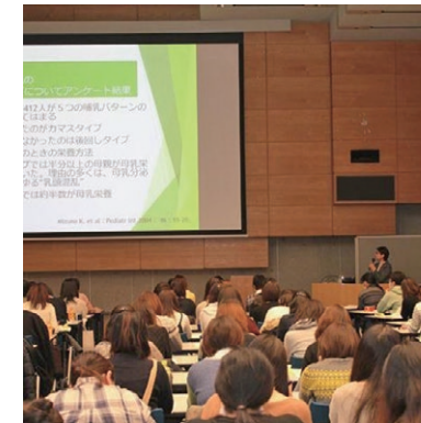
オフラインセミナーの様子